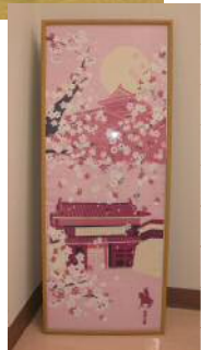
「上田城と桜」 タペストリーとしても、額で絵画風に飾ってもキレイです。

長野の風物・風景を題材にシリーズ化した和雑貨を作っていきたいと考えていて、第1弾に御柱祭を題材にした手拭本を作りました。もともと「御柱祭」はストーリーのあるお祭りなので、捲って楽しめるという手拭本の企画の中にはまりました。 長野のお土産という食べ物を中心なんですけど、もともと当社は繊維の会社なので、少し差別化できるような物をといたところで多色を使った手拭いを作ることにしました。 多色はどうしてもコストが掛かりますが、クオリティーの高い物を観光客の方や県内の方に提供していくことが大事だと思います。クオリティーの高さ、日本製、そういうところにこだわりながら、それを崩さないようにシリーズ化していくつもりでやっています。