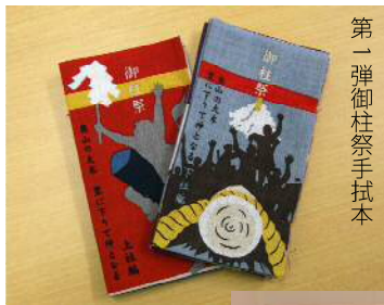
第一弾御柱祭手拭本

我々は、今までどちらかというと企画中心で黒子の役割りをしてきました。 今回は自社ブランドという形で、もっと石森という企業名を出していこうと考えました。 企画ものをきちっと作る事で、商談に結びついても早いですし、オリジナル性の強い武器さえ作ればそれだけ販売チャンネルが広がると思います。